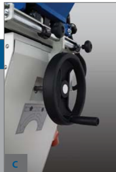
C - MECHANICKÉ NASTAVENÍ VÝŠKY JEDNOTKY