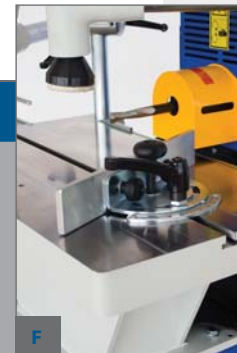
F - ÚHLOVACÍ PRAVÍTKO +/- 45°