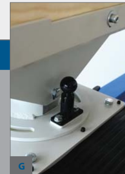
G - ZAJIŠTĚNÍ NASTAVENÉHO ÚHLU VŘETENA