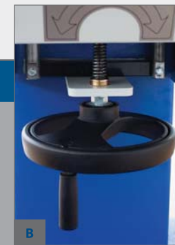
B - MECHANICKÉ NASTAVENÍ VÝŠKY JEDNOTKY