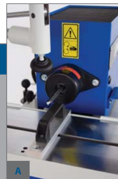
A - VRTACÍ JEDNOTKA