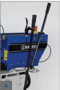
A - DVOUPÁKOVÉ PROVEDENÍ