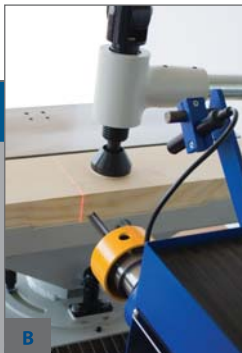
B - PRŮMYSLVÝ LASER