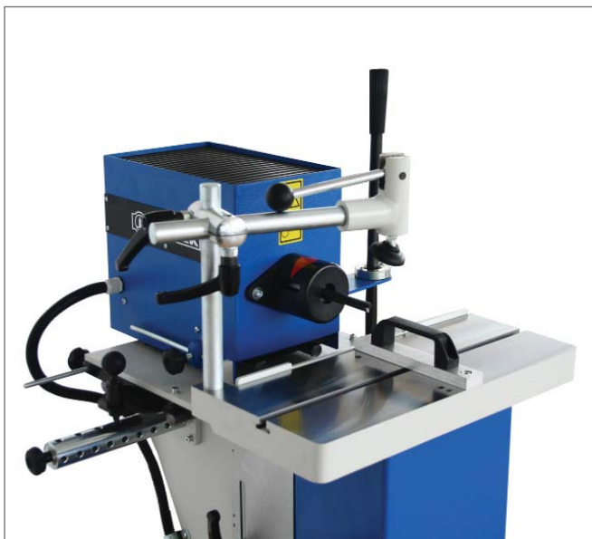
VOLITELNÉ VYBAVENÍ: KLÍKOVACÍ ZAŘÍZENÍ + NULOVÉ PRAVÍTKO