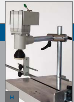
H - PNEUMATICKÉ UCHYCENÍ OBROBKU