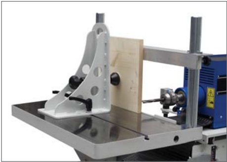
ZAŘÍZENÍ NA UPÍNÁNÍ DESKOVÉHO MATERIÁLU