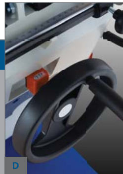
D - MACHANICKÉ ČÍSLICOVÉ ODMĚŘOVÁNÍ VÝŠKY VŘETENA