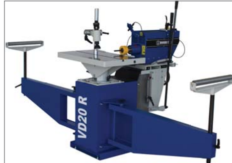
LEVÁ A PRAVÁ PODPĚRA S VÁLEČKEM 1400 MM