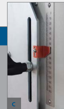
C - UKAZATEL VÝŠKY JEDNOTKY