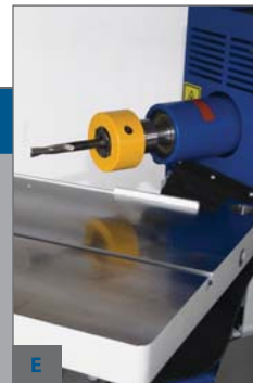
E - PRODLOUŽENÁ HŘÍDEL