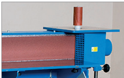
HB900 Drive S HORNÍM PŘÍDAVNÝM STOLEM VČETNĚ BRUSNÉHO VÁLEČKU