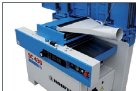
| SC 430 - pracovní plocha s odsáváním