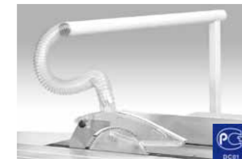
STANDARD BASIC Protezione GOST / GOST safety guard Protecteur GOST GOST Schutzvorrichtung / Protección GOST / Защита пилы по ГОСТ стандартная комплектация.