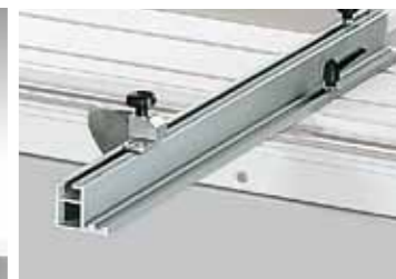
OPTION Squadra in alluminio + 30° - 45° +30°-45° tilting aluminium fence Guide en aluminium + 30° -45° Alu-Gehrungsanschlag +30°-45° Eascuadra en aluminio + 30° -45° Алюминиевый упор +30°-45°