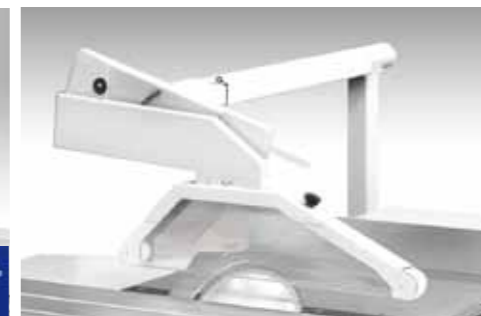
OPTION - STANDARD FOR USA-CANADA Protezione a parallelogramma bocca Ø 80 mm / Parallelogram guard Ø 80 mm / Protecteur lame sur potence Ø 80 mm / Parallelogrammsägeschutz - Absaughaube Ø 80 mm / Protección del disco colgado Ø 80 mm / Параллелограммная защита пилы с аспирационным отверстием 80 мм