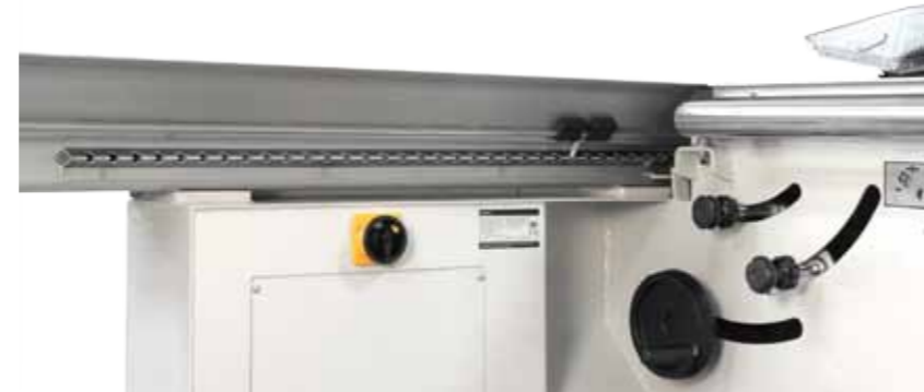
Bloccaggio Carro in tutte le posizioni Blocage du chariot dans toutes les positions Bloqueo carro en todas las posiciones