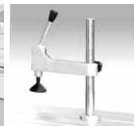
STANDARD Pressalegno Wood presser presseur de bois Holzspanner Prensamadera Прижим