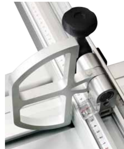
Sliding table locking in all positions Blockierung des Alu-Schlittens in allen Positionen Блокировка каретки во всех положениях