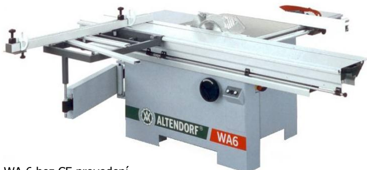
WA 6 bez CE provedení