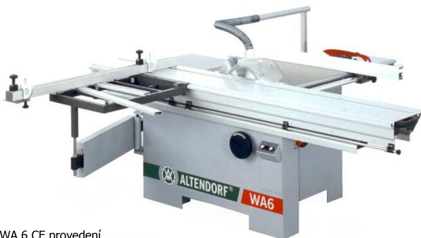
WA 6 CE provedení